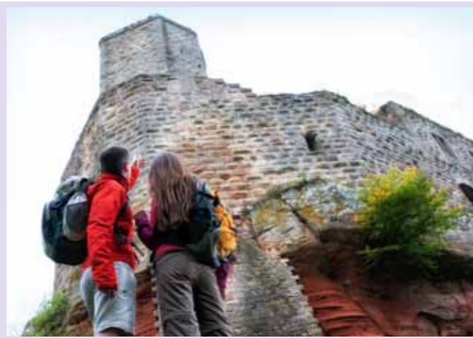
WANDERER AUF GRÄFENSTEIN